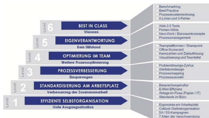
Das 6 Level-Modell von Office Excellence

Weitere Informationen unter: www.office-excellence.com