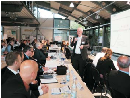
Best Practice-Vorträge im Plenum