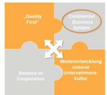
CBS bei Continental

Continental in Ingolstadt ist mit seinen über 1700 Mitarbeitern Leadplant für Fahrerassistenzsysteme und erzielt durch die Produktion innovativer Fahrzeugelektronik im Bereich Fahrsicherheit und Fahrkomfort einen permanenten Fortschritt. Das Werk Ingolstadt entwickelt bzw. fertigt u.a. Bremssysteme, Tür- und Sitzsteuergeräte sowie Kamera-, Radar- und Lidarsysteme. Im hochmodernen Umweltsimulations- und Prüflabor werden Produkte der Continental auf Funktionalität und Sicherheit getestet.