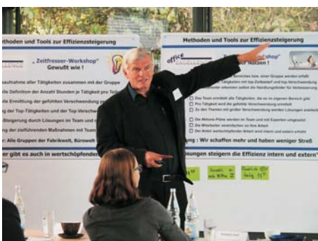
Diskussionen und Experten in Workshops